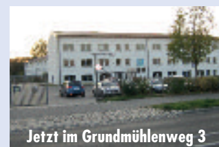
Jetzt im Grundmühlenweg 3

Voraussichtlich bis Mai 2012 wird der Mieterverein Uckermark für Angermünde und Umgebung wegen Baumaßnahmen am Gebäude Straße des Friedens 5 a den Sprechtag donnerstags von 14.00 bis 17.00 Uhr im Grundmühlenweg 3, im Gebäude des ehemaligen Arbeitsamtes, durchführen.